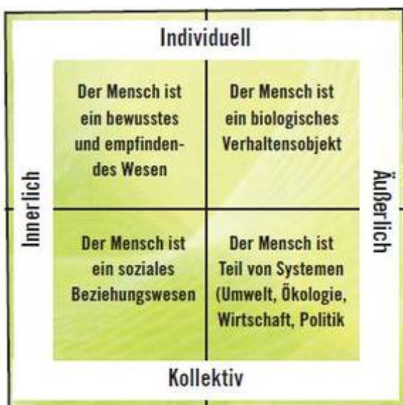
Abb. 2: Vier Menschenbilder