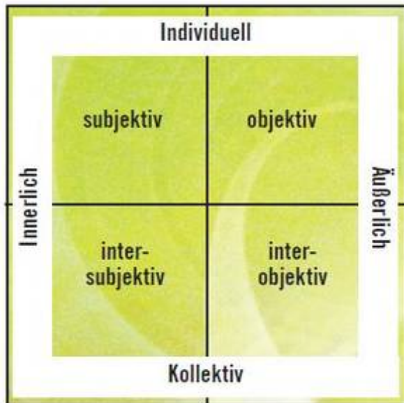
Abb. 1: Die vier Quadranten als Perspektiven von und auf Wirklichkeit